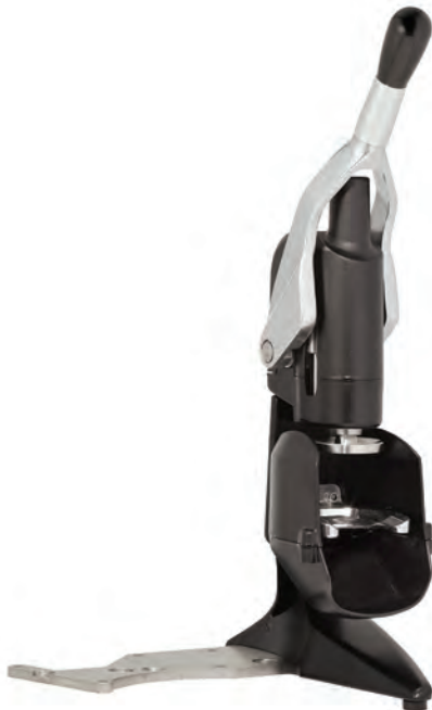
Pressino dinamometrico - Dynamometric tamper