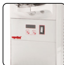
Versione ETC / ETC version